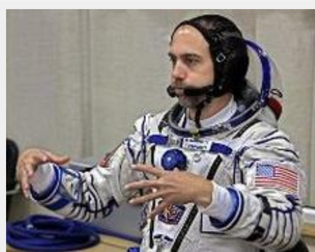
22 Millionen Euro bezahlte der Software-Entwickler Richard Garriott für seinen »Ausflug« zur ISS.