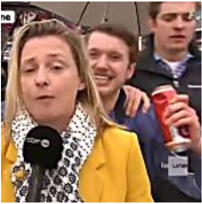
RTBF-Journalistin im Karneval unsittlich berührt - 17-Jähriger meldet sich