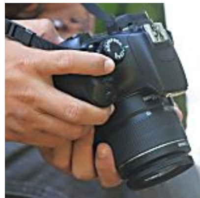
Tipps zum Einstieg in die RAW-Fotografie (Onkel Zoom)