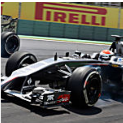
Millionenklage vor Gericht droht (Autobild)