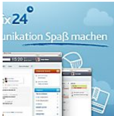
Bitrix24: Social Intranet auch Startups (Gründerszene)

SPONSORED Content empfohlen von Outbrain