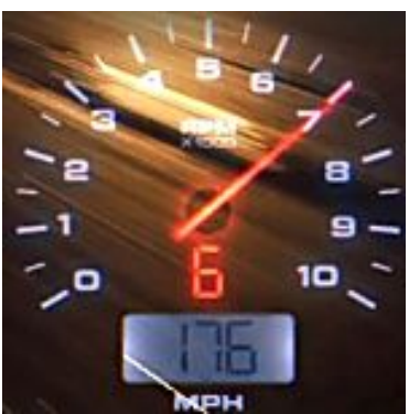
PC-Version für NFS geht ab (Autobild)