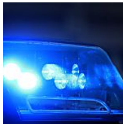
Zone Eifel: Fahrerflucht, Einbrüche und überladener LKW