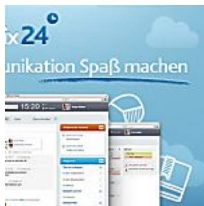
Bitrix24: Social Intranet auch Startups (Gründerszene)

SPONSORED Content empfohlen von Outbrain