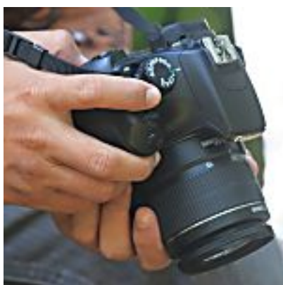
Tipps zum Einstieg in die RAW-Fotografie (Onkel Zoom)