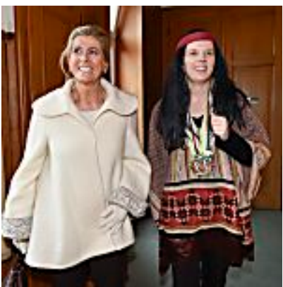
Eine Prinzessin in Eupen: "Was heißt Alaaf?!"