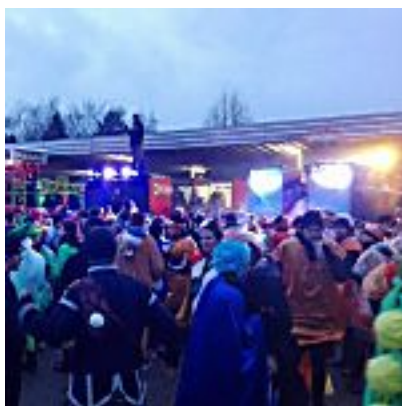
[Video] Nach dem Zug ist vor der Bushof-Party